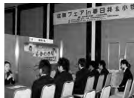
▲「就職フェア」の風景

春日井・小牧合同での「就職フェア」を開催し会員企業の人材確保を支援します。また人材採用にかかるセミナー・個別支援を行い、その上に市内大学、実業高校と連携し高いスキル・技術を持つ学生とのマッチングを行います。これらを通じて会員企業が「良い人材」を採用できるための支援をします。