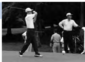
▲会員交流ふれあいゴルフ大会

会員相互の親睦・交流と健康増進を目的に毎回約200名の参加を得、ゴルフ大会を開催します。