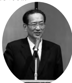
▲早稲田大学大学院教授 北川正恭氏の「新春経済講演会」

珠算・簿記・販売士・福祉住環境コーディネーター等13種の検定試験を行っています。