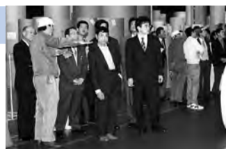
▲部会で「工場見学会」

会員企業の発展に貢献するため、それぞれの業種ごとに部会を設置し、業種別講習会・見学会などの事業活動を行っています。又、地域の課題等について調査研究するため、「地産地消」委員会等6つの委員会を設置しています。