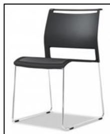
スタッキングチェア