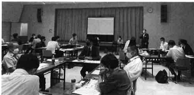
(BCP ワークショップの様子)

イ. 策定支援 上記の参加者を対象に18社中13社フォローアップを行った。 うち4社に対し同行巡回を行った。