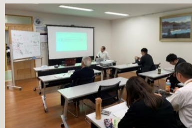
過去の後継者育成塾の様子