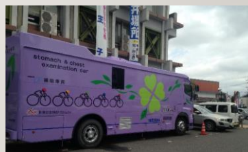
定期健康診断の様子