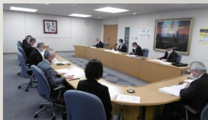
春日井市への要望書提出の様子