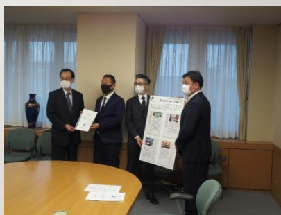
政策提言提出の様子