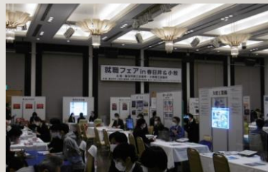
就職フェアin春日井・小牧の様子