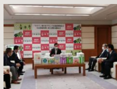
ネピア寄付金贈呈式