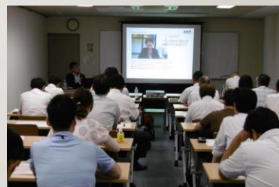
過去、実施したセミナーの様子