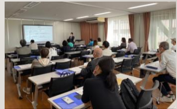
かすがい創業塾の様子