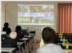
春日井市母子寡婦福祉会への寄付の様子