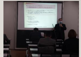
デジタル化セミナーの様子