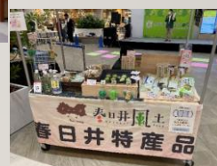
春日井特産品認定品