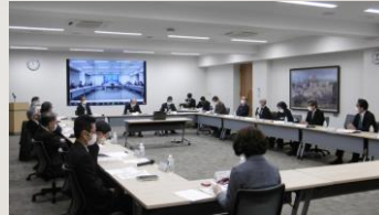
中部大学特命教授の会の様子(上)