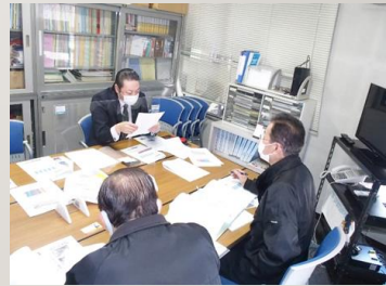
伴走型支援「専門家派遣」の様子