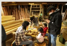
春日井まちゼミの様子