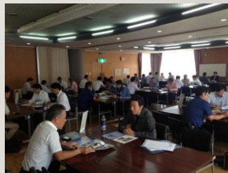
過去の尾張広域商談会の様子

発注企業（仕事を出す先）もしくは 受注企業（仕事を受ける先）として 参加する春日井市内企業の数