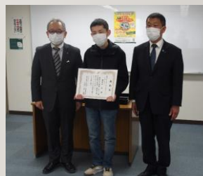
ぐるりんグルメ表彰式