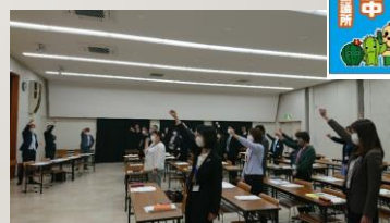
共済進発式の様子