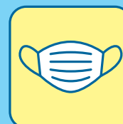
従業員一同の マスク着用