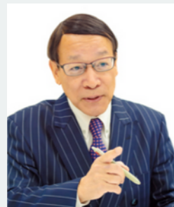
(株)北見式賃金研究所 代表取締役