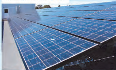
磐田地方合同庁舎 様