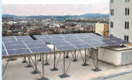
多治見市池田下水処理場 様