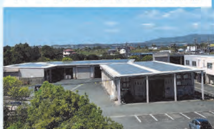
リゾートホテル併設ゴルフ場 管理棟 様