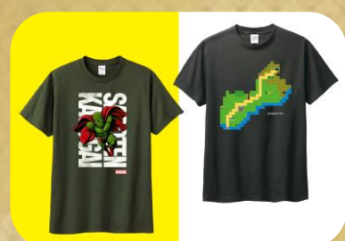
WAWAWA 春日井Tシャツ 3,800円(税込)