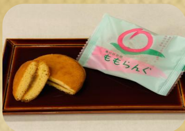
御菓子処 美濃屋 ももらんぐ 200円(税込)