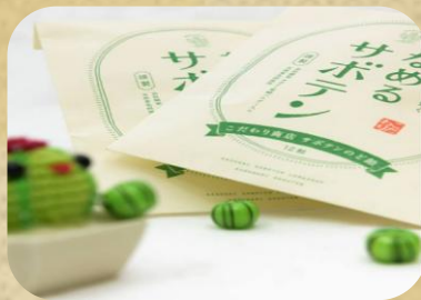
こだわり商店 サボテンのど飴 430円(税込)