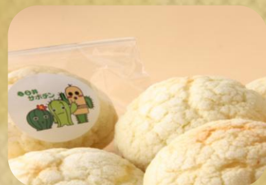
(株)モンシエル サボテンメロン 120円(税込)