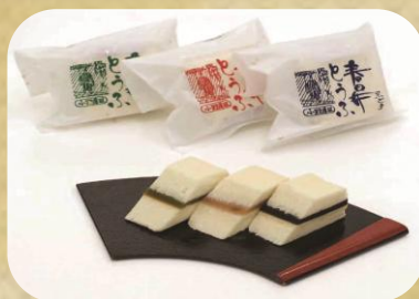
(有)陶勝軒本舗 春日井とうふ 240円(税込)