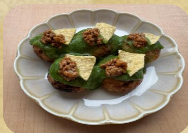
たころんcafe さぼてんたこ焼き 550円(税込)