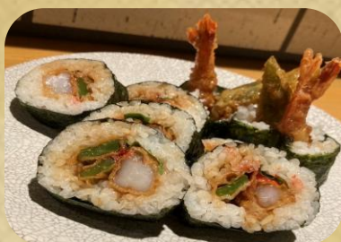
天ぷら 寿司 やじま。 サボ天まる 600円(税込)