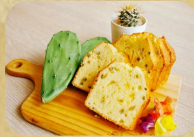
IZUMI cafe & bistro サボテンパウンドケーキ 210円(税込)