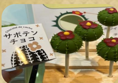
パンプルムースseiji サボテンチョコ 300円(税込)