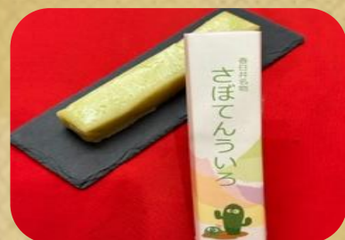
御菓子司 美乃雀 さぼテンういろ(ハーフ) 350円(税込)