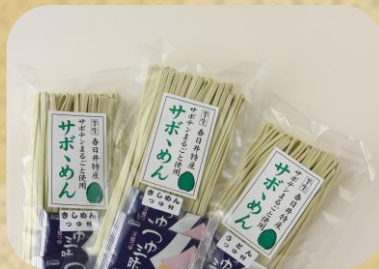
田中食品製麺(株) サボ、めん 450円(税込)